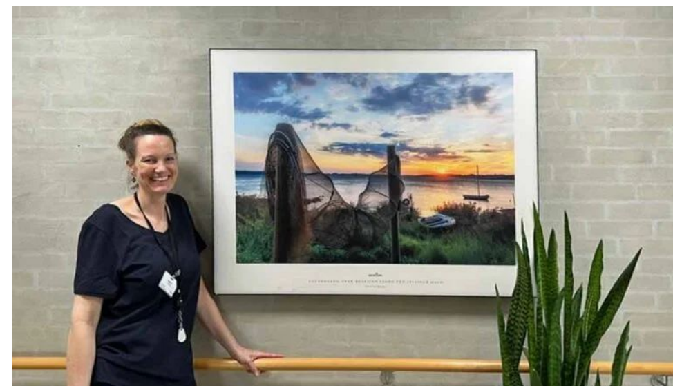
Tryghedsskabende kunst på Bauneparken

Vi arbejder meget med brugerinddragelse i udvælgelse af motiver og evalueringer.