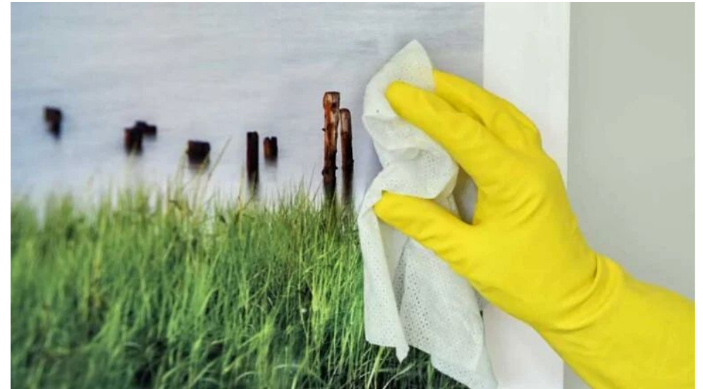
Sonovisions akustikbilleder anvendes på sygehuse med behov for daglig desinfektion af overflader.

Lærreder kan tages af og maskinvaskes op til 90 grader.