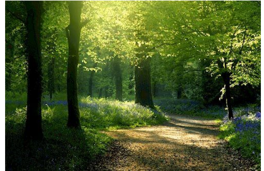
Typiske udsagn fra patienter: "Det giver mig ro, og det giver mig gode minder"

Vi har også siden involveret os meget i forskning inden for vores felt.